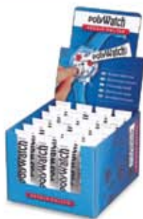
Display com 24 tubos