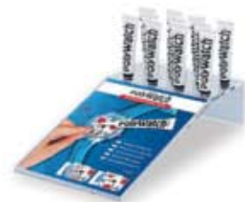
Display com 11 tubos