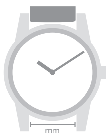
Tabela de medidas disponíveis

Siga as indicações deste manual para seleccionar a bracelete correcta para o seu relógio. As dimensões podem variar consoante a resolução do ecrã em que está a visualizar este documento. Para assegurar uma medição correcta, por favor imprima esta folha numa escala de 100%.